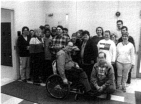
Employés de Certex

Nous sommes un organisme de charité dûment enregistré et depuis 1996, Certex est reconnu comme Centre de travail adapté par l'Office des personnes handicapées du Québec. En 2001, Certex a construit un nouveau centre de tri des textiles de source post-consommation de plus de 44 000 pieds carrés.