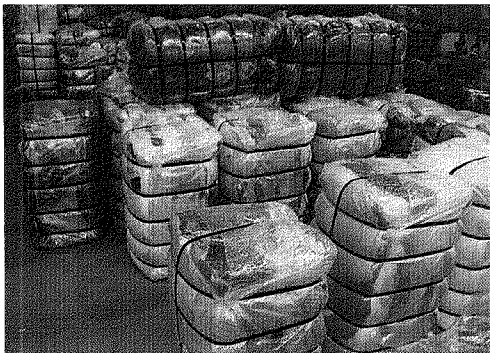
Ballots de textiles