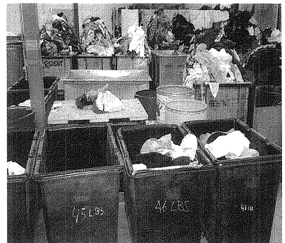
Bac de linges à trier